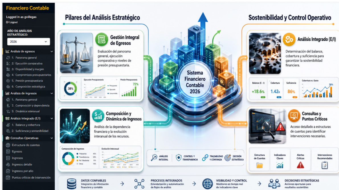
Figura 3. Estructura del análisis estratégico financiero contable UNED 2026

Este conjunto de indicadores ayuda a demostrar que la optimización de decisiones no se fundamenta únicamente en la existencia de gráficos, sino en una estructura de análisis documentada. Cada indicador cumple una función dentro del proceso decisional: algunos permiten conocer el avance de la ejecución, otros identifican márgenes operativos, otros advierten compromisos o presiones, y otros permiten valorar balance y sostenibilidad. De esta manera, el dashboard convierte los datos presupuestarios en un sistema de lectura institucional.