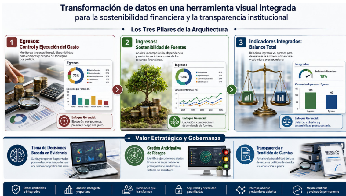
Figura 2. Arquitectura gerencial de dashboard de presupuesto

La optimización de decisiones se evidenció en la capacidad del dashboard para pasar de una lectura meramente descriptiva del presupuesto a una gerencial. El documento del dashboard presupuestario señala que la herramienta permite identificar niveles de ejecución, márgenes de disponibilidad, peso de compromisos, presión presupuestaria, posibles sobregiros, concentración del gasto, dependencia de fuentes de ingreso y relación entre ingresos y egresos. Esta estructura permite que las autoridades y los equipos técnicos no solo observen montos, sino que identifiquen señales clave para seguimiento, priorización y análisis institucional.