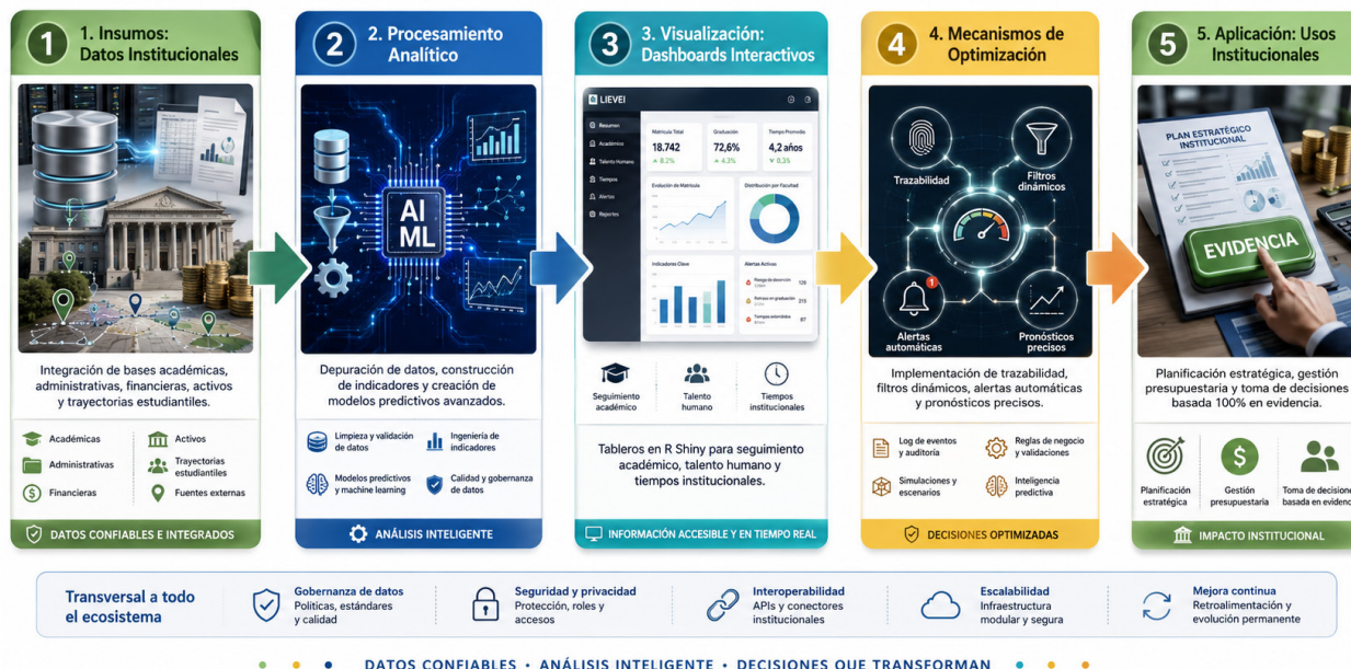
Figura 1. Arquitectura institucional del ecosistema LIEVEL: de los datos a la toma de decisiones

La primera contribución del ecosistema consistió en articular datos institucionales dispersos dentro de una plataforma de consulta interactiva. En lugar de depender solo de reportes estáticos, archivos separados o solicitudes específicas de información, los dashboards permitieron explorar indicadores mediante filtros, gráficos, tablas dinámicas y visualizaciones adaptadas a distintos niveles de decisión. Esta integración cobra importancia porque transforma registros administrativos y académicos en información utilizable para la planificación, el seguimiento, la evaluación y la rendición de cuentas.