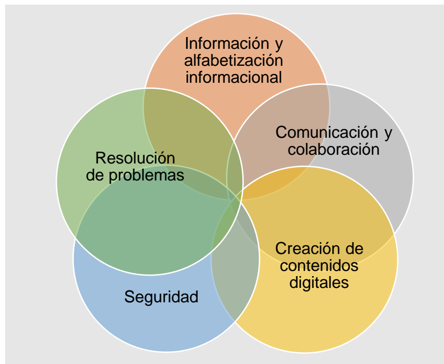
Figura 2: Marco de competencias de los docentes en materia de TIC

Nota: Elaboración propia a partir de Intef, 2017.