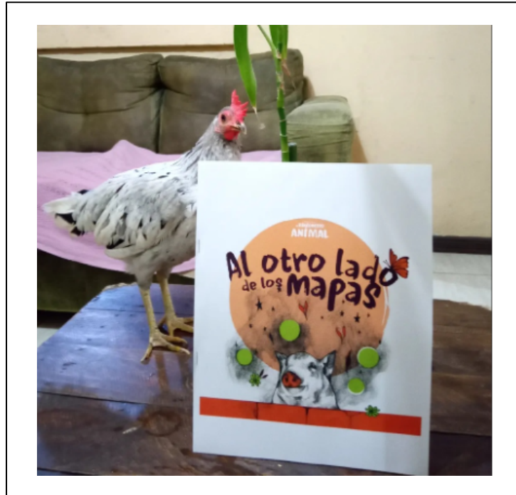
Figura 4. La gallina Passiflora promocionando el libro de Clavel