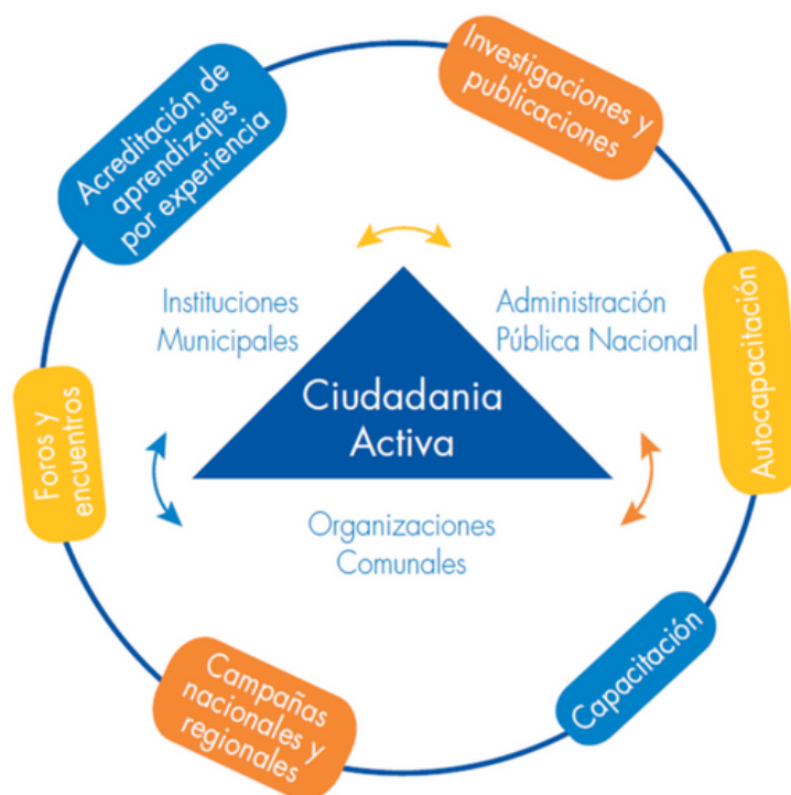
Figura 2. Servicios educativos del IFCMDL