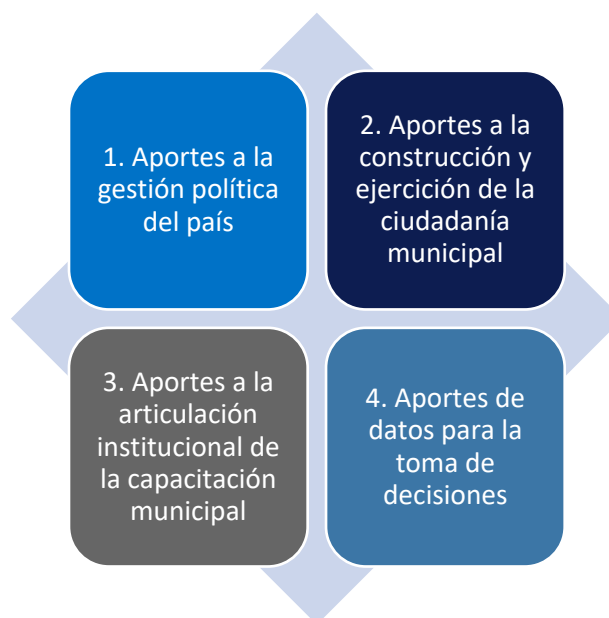
Figura 3. Estructura del artículo