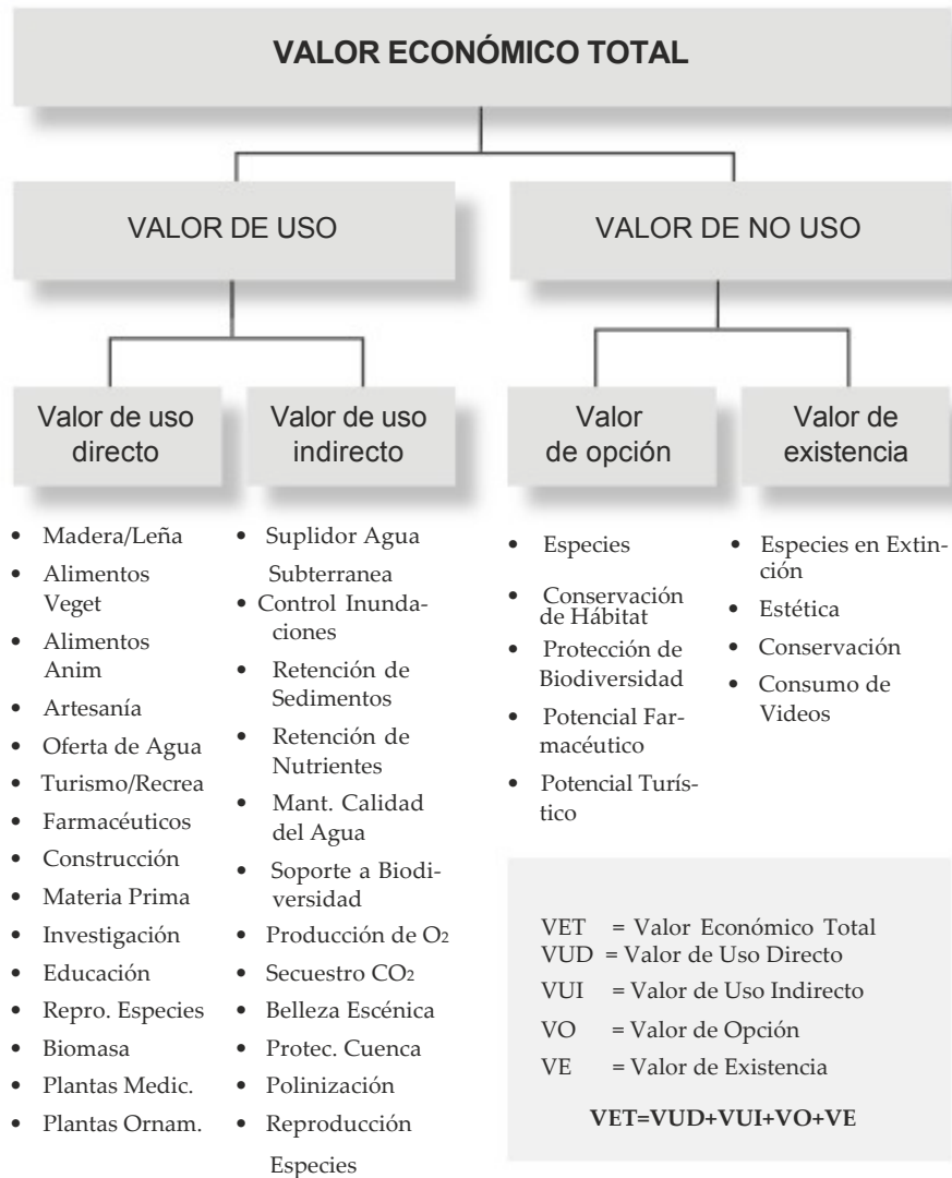
Figura 1 COMPONENTES DEL VALOR ECONÓMICO TOTAL PARA BSA