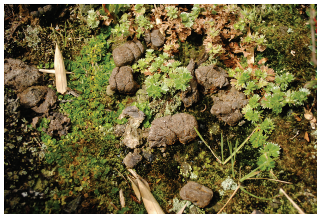
Fig. 3. Heces de Mazama americana en la zona de estudio de Valeriana prionophylla a 3 332msnm, 9,58626808N, -83,76653552W

Correlación de Spearman. ** = p < 0,01 , * = p entre 0,01 y 0,05, NS= no significativo.