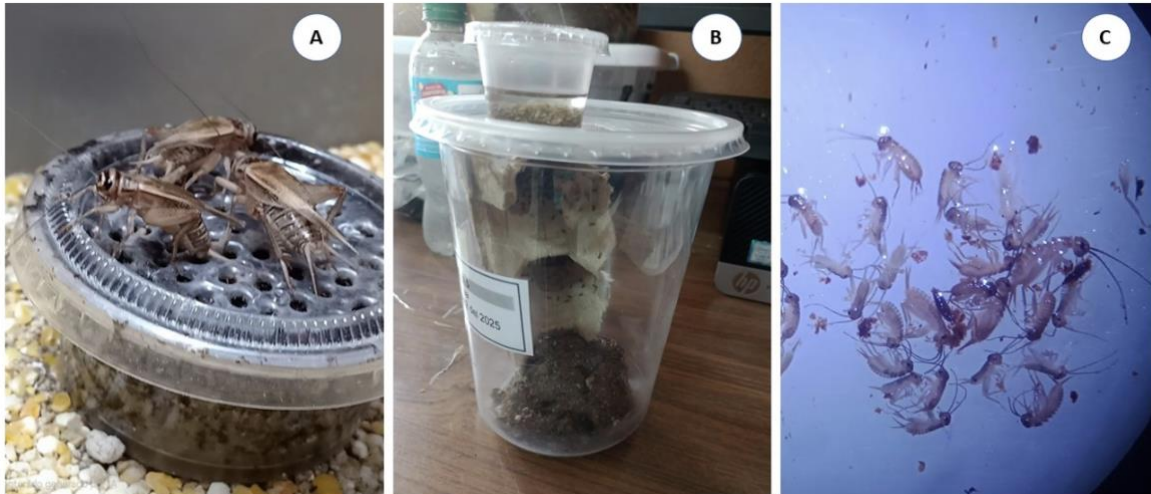
Fig. 1. Ensayos de calidad y preferencia de sustratos para la oviposición de A. domesticus . A. Oviposición de hembras, B. Emergencia y cosecha de ninfas, C. Almacenamiento de ninfas en alcohol.

Preferencia de sustrato: a diferencia del primer ensayo, en este no aplicamos un diseño estadístico definido; sin embargo, incrementamos el número de unidades experimentales a 15, con el fin de obtener datos más concluyentes. En cada unidad incorporamos inicialmente quince hembras y cinco machos de A. domesticus , cuya descendencia generó aproximadamente 300 parejas reproductoras y con esta población iniciamos el experimento.