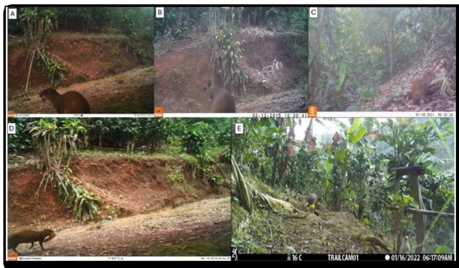
Fig. 4. Ítems consumidos en el sitio de estudio por Dasyprocta punctata (A) Polyporus sp, (B) Inga densiflora , (C) Cecropia peltata (D) Musa paradisiaca (E) Citrus sinensis . Rincón de Mora, San Ramón, Costa Rica.

en las cámaras trampa persiguiendo a un individuo de D. punctata , presa potencial de este depredador.