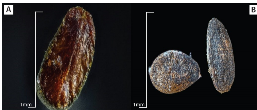
Fig. 5. Ítems consumidos presentes en el área de estudio por Philander melanurus (A) Conostegia xalapensis y (B) Piper hispidum . Rincón de Mora, San Ramón, Costa Rica.