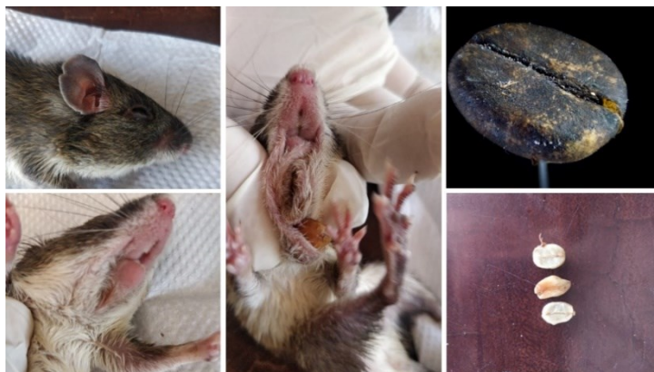
Fig. 2. Granos de Coffea arabica extraídos en las bolsas de Heteromys salvini en Rincón de Mora, San Ramón, Costa Rica.

Dasyprocta punctata (guatusa) (N=87) fue la especie de la cual obtuvimos más información. En cámaras trampa registramos a este roedor consumiendo Polyporus sp (hongo) y M. paradisiaca . Asimismo, la observamos alimentarse de Persea americana (Mill, 1768) (aguacate), Sechium edule (Jacq. Sw. 1800) (chayote), Eugenia stipitata (Mc Vaugh, 1956) (arazá), Psidium friedrichsthalianum (Berg.) (cas), P. guajava , Citrus aurantifolia (Christm) (limón dulce), Citrus reticulata (Blanco, 1837) (mandarina), Citrus sinensis (Linneus, 1753) (naranja), I. densiflora (Benth, 1875) y Cecropia peltata (Linneus, 1759) (guarumo), especies de plantas que potencialmente podría estar dispersando (Fig. 4) (Tabla 2).