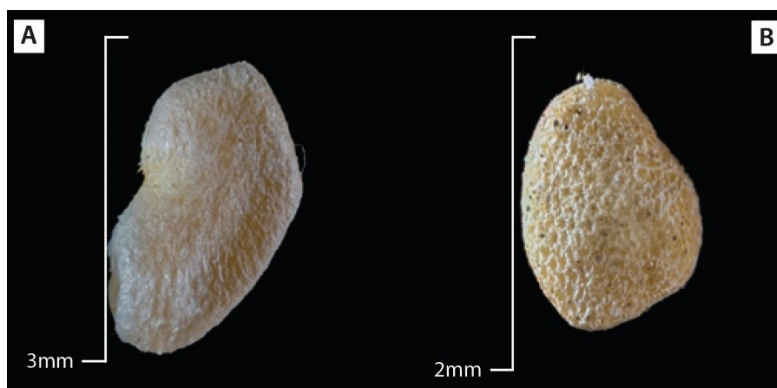
Fig. 3. Semillas consumidas por Echinosciurus variegatoides , (A) Psidium guajava y (B) Lochroma arborescens . Rincón de Mora, San Ramón, Costa Rica.

Philander melanurus (zorro de cuatro ojos) (N=3) consumió Piper hispidum (Sw.) (candelillas) y Conostegia xalapensis (Bonpl, 1825) (capulín) dada la presencia de estas semillas en sus heces (Fig. 5). Mientras que Didelphis marsupialis (zorro pelón) (N=20) la observamos comiendo M. paradisiaca (Linneus, 1753) (Tabla 2).