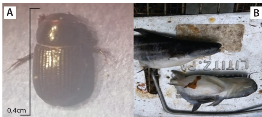
Fig. 6. Ítems consumidos en el área de estudio por Procyon lotor (A) Scarabeidae subfamilia Aphoniinae y (B) Pangasius hypophthalmus . Rincón de Mora, San Ramón, Costa Rica.