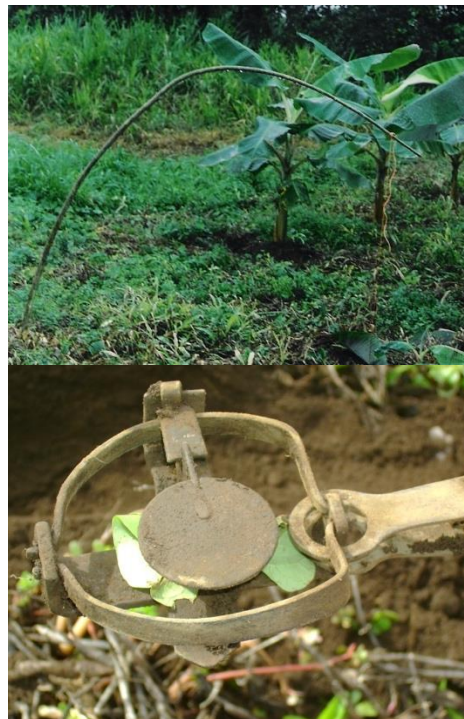
Fig. 2. Trampas para taltuzas utilizadas para la captura de taltuzas.

Otra técnica poco común, utilizada por cuatro productores, es el uso de baterías de foco o linterna. Finalmente, y solo reportado por dos productores, se encuentra el uso de armas de fuego.