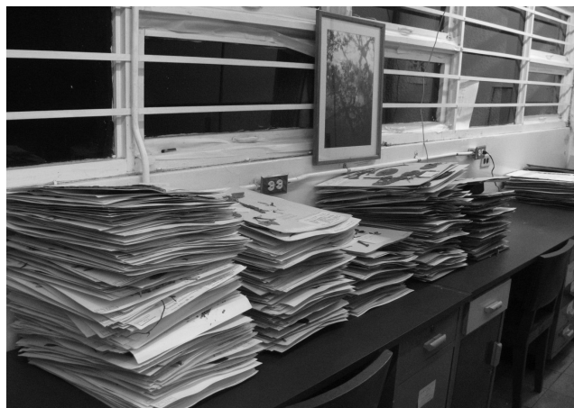
FIG. 3. Pilas de ejemplares de dicotiledóneas secos, después de haber estado en una secadora de plantas, listos para ser reparados. Herbario USJ. Foto del autor, julio de 2008.

En Ocean Springs, Misisipi (EE. UU.), el Herbario Pullen (MISS), que cuenta con unos 62 000 especímenes