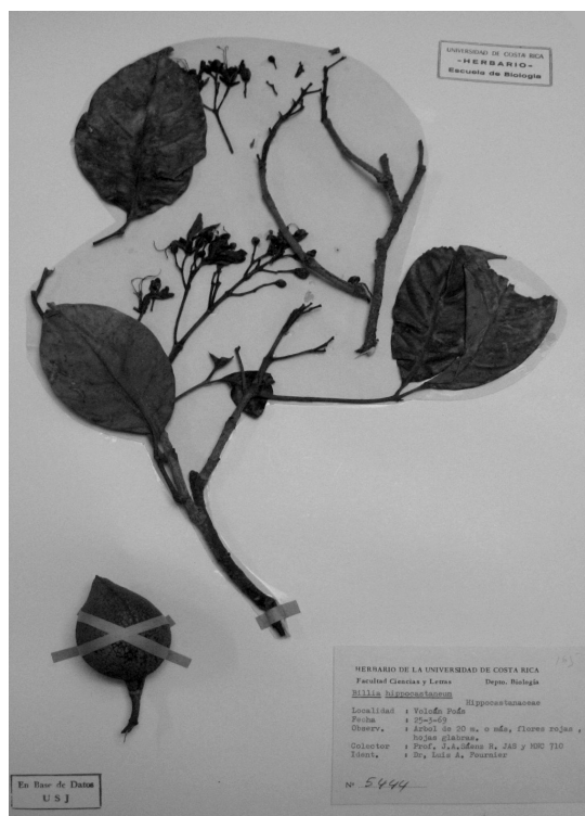
FIG. 5. Aspecto de un ejemplar reparado. La cartulina original dañada fue recortada cuidadosamente y sustituida en gran parte por una nueva. Herbario USJ. Foto del autor, julio de 2008.

de plantas y otros grupos, fue severamente dañado por el huracán Katrina en agosto de 2005. Allí se organizó un proyecto de restauración, que consistió primero en conformar un equipo de trabajo, que incluyó voluntarios. Los gabinetes caídos debieron primero levantarse y colocarse en posición vertical. Parte del material más valioso en términos de conservación regional fue enviado a la Universidad Estatal de Luisiana. Dos personas examinaron el material de los gabinetes, lo separaron y rotularon según su estado: seco, húmedo, húmedo y enmohecido, empapado, empapado y enmohecido, etc. Fuera del herbario se sustituyeron carpetas y cartones mojados. Ningún fajo de especímenes se abrió, debido a que esto hubiera causado más daño; además, no hubo espacio ni electricidad para tratar individualmente cada espécimen. Los fajos se agruparon a la sombra, según su condición; los secos se pusieron en cajas para el transporte; los húmedos y empapados en bolsas plásticas. Cajas y bolsas fueron rotuladas, puestas en vehículos y enviadas a varias instituciones que poseen congeladores. Se registró por escrito el destino de