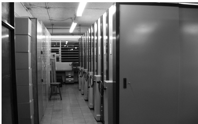
FIG. 1. Aspecto del sistema compactador (derecha) con la colección de dicotiledóneas del Herbario USJ. Foto del autor, enero de 2013.

Ni un solo espécimen vegetal montado y catalogado se perdió. No obstante, en el cuarto de montaje había material en proceso, guardado en cajas de cartón, fuera de gabinetes, que sí se perdió porque fue imposible ponerlo todo a tiempo en la secadora de plantas. Sin embargo, sólo se trataba de duplicados de material común (por ej., ningún tipo ni ejemplares únicos de especies raras) o de material sin importancia porque tenía varios años en espera de datos, que los recolectores nunca enviaron a USJ. La prioridad absoluta era salvar los especímenes montados y