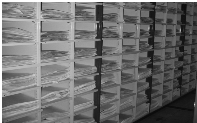
FIG. 2. Sistema compactador abierto para mostrar la organización en gavetas con carpetas de especímenes. Herbario USJ. Foto del autor, enero de 2013.