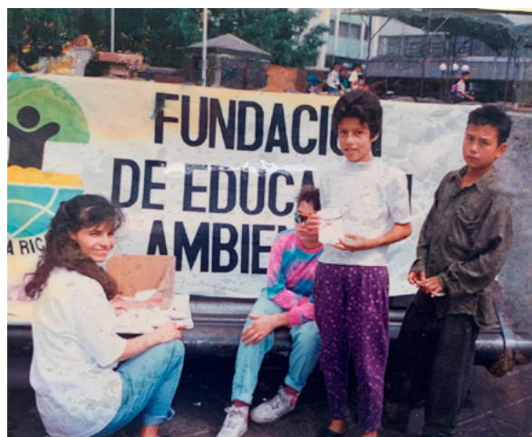
Figura 1 Taller de educación ambiental

Los eventos citados se llevaron a cabo en coordinación con las municipalidades, el Instituto Mixto de Ayuda Social (IMAS), la Fundación Costa Rica Canadá y la Universidad Estatal a Distancia (UNED), así como otras instituciones educativas públicas y privadas. Algunas de las Municipalidades participantes fueron las de Curridabat, Bagaces, Nandayure, Puriscal, San Antonio de Belén, Esparza y Sarapiquí, entre otras.