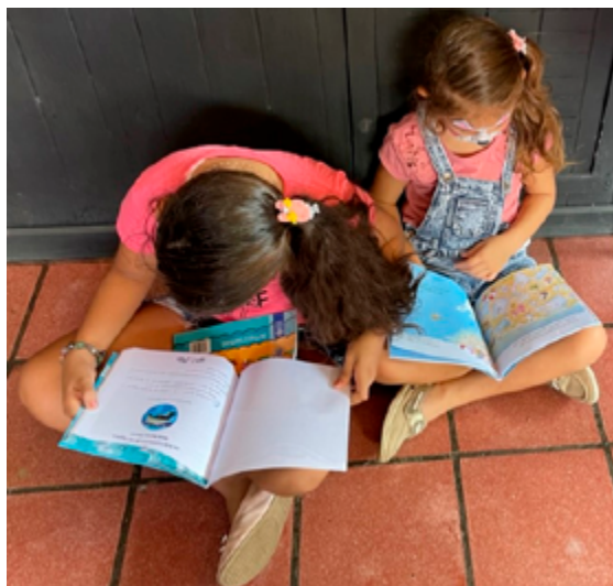
Figura 3 Niñas leyendo la Serie Mapachín, Puntarenas, junio 2022

Un instrumento vital para todo docente y educador ambiental es la literatura infantil, la cual estimula el pensamiento, despierta la imaginación, promueve la reflexión, la creatividad, transporta al lector a descubrir nuevos mundos, sensibiliza, es lúdica y transmisora de mensajes y valores, en todo ello reside su fortaleza y valor para la educación ambiental (Brenes y Rojas, 2021). Y es así como el material literario con el que el lector asocia, relaciona, conoce y construye su propio aprendizaje, se convierte en un aliado del crecimiento infantil tanto en lo afectivo como en lo cognitivo.