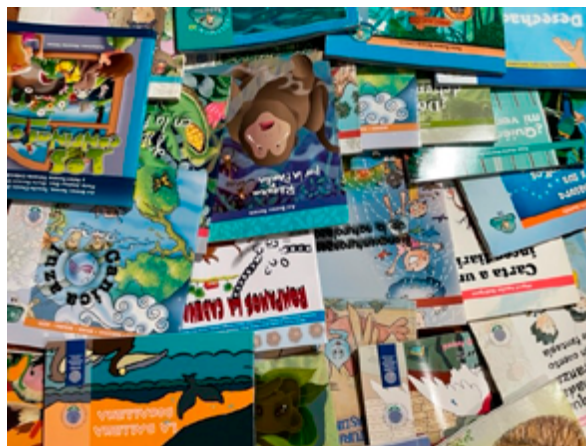
Figura 4 Algunos títulos de la Serie Mapachín

Nota. Fotografía de Sonia Rojas, junio 2022.