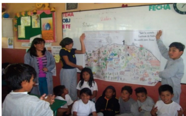
Figura 6. Estudiantes de la Unidad Educativa Tumbaco mostrando orgullosos su poster terminado.

constructivos (Figura 6). Los maestros destacaron el efecto positivo de la actividad y expresaron su interés en poder contar con más recursos similares en sus clases en el futuro.