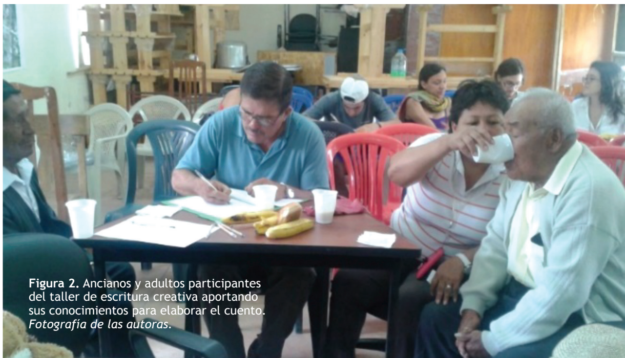
Figura 2. Ancianos y adultos participantes del taller de escritura creativa aportando sus conocimientos para elaborar el cuento.

Como se presenta en la Figura 5, en los dos primeros talleres los cambios ocurrieron en mayor proporción en el eje de conocimiento, seguido por el de conciencia y en menor proporción por el de acción.