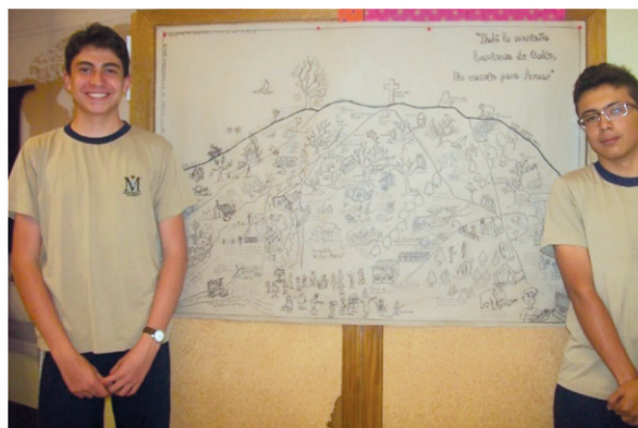
Figura 4. Estudiantes de Montebello Academy mostrando el poster final del Ilaló.

Los cambios más llamativos ocurrieron en los talleres de composición gráfica del poster, debido quizá a la duración del proceso (tres talleres), a la incorporación de más actividades cognitivas (Juárez, 2014) y al proceso creativo-reflexivo seguido para elaborar el póster (Díaz y Muñoz, 2013). Los cambios en conocimiento se atribuyen a que la audiencia no conocía previamente sobre el Ilaló por lo que la información fue asimilada como un nuevo conocimiento. Los cambios en