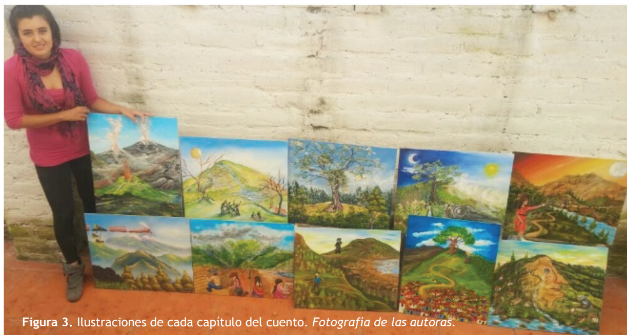
Figura 3. Ilustraciones de cada capítulo del cuento.

Los cambios en conocimiento, se deben probablemente a que a pesar de que los participantes tenían conocimientos previos, adquirieron otros nuevos o los complementaron en los talleres, mientras compartían información para escribir el cuento, leían las narraciones o aprendieron nuevos conocimientos a partir de las charlas introductorias. Las actividades artísticas tanto de escribir historias como ilustrarlas estimularon aparentemente los cambios en el eje de conciencia, sin embargo, cabe destacar que al ser la toma de conciencia un proceso progresivo y reflexivo, de auto-análisis, reafirmación de conceptos y compromisos, requiere mayor tiempo para ser evidenciado. Los cambios en el eje de acción son menores debido a que muchos de los participantes realizaban ya actividades culturales y ambientales a favor del volcán antes de participar en los talleres.