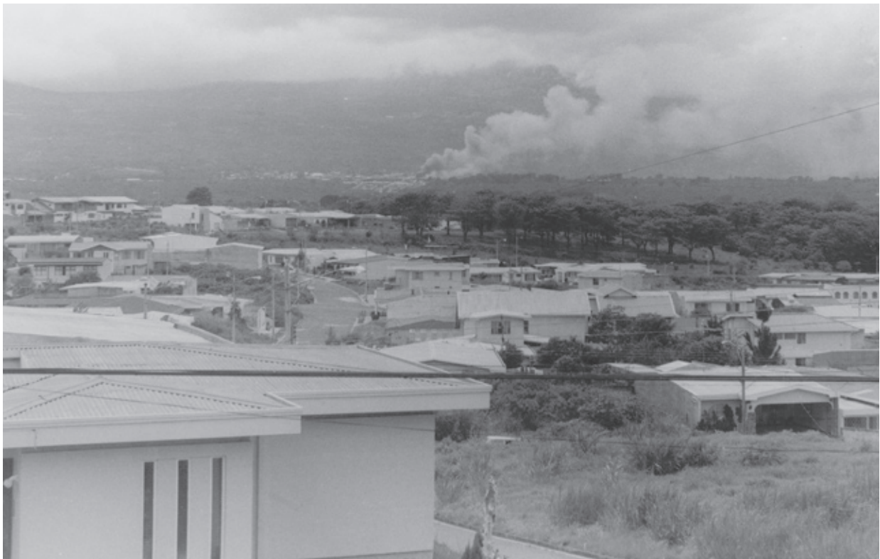
Martín Villalta Quirós

Los diferentes barrios o vecindarios deben estar caracterizados por factores que de alguna manera influyan en su confort como son: trayectos seguros entre las escuelas y los domicilios, el espesor y la calidad de los pavimentos, la protección de las viviendas en relación con las