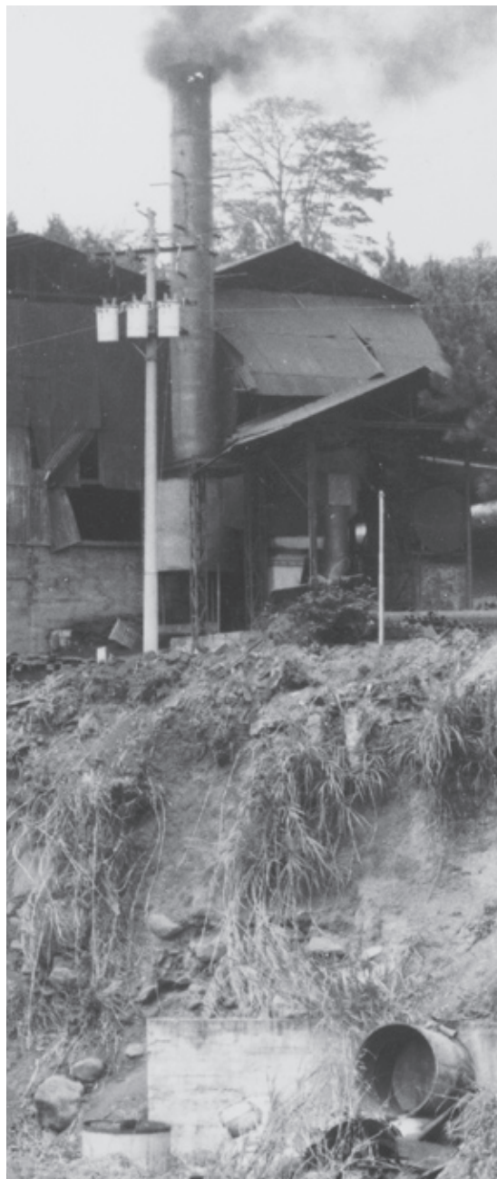
La falta de planificación urbana ocasiona serios problemas sociales y ambientales.

Algunos aspectos importantes que se deben tomar en cuenta para propiciar el desarrollo urba-