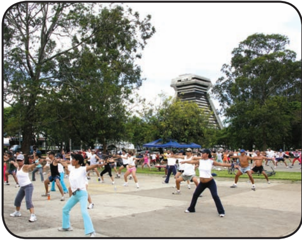
FIGURA 2. En muchas zonas de la Meseta Central se sembraron principalmente eucaliptos y cipreses, causando daños al ecosistema que se quería recuperar. Un ejemplo es el Parque Metropolitano La Sabana, que favorece las prácticas deportivas pero no es un buen hábitat para muchas especies locales de fauna.