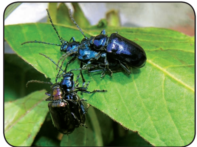
FIGURA 3. Muchas especies animales requieren plantas nativas para su reproducción, como estos coleópteros. En Costa Rica, actualmente existen algunos viveros que trabajan con plantas nativas, pero no representan la verdadera riqueza genética de la flora costarricense.

Una de las prácticas más generalizada es sembrar únicamente las especies arbóreas, dejando que el sotobosque se restablezca solo. El éxito de esta medida depende en gran parte de que se consideren los principios básicos de la biogeografía de islas (Monte-Nájera, 2008). En Costa Rica, se ha observado que en el bosque tropical húmedo -en 10 años- el sotobosque se restablece considerablemente gracias a la actividad de animales dispersores de semillas y lo mismo ocurre en el bosque estacional cuando simplemente se evitan los incendios forestales y la entrada de grandes herbívoros (Leopold y Salazar, 2008). En bosques montanos es probable que se requiera más tiempo debido a que la temperatura más baja hace que los procesos biológicos sean más lentos. En el caso de zonas urbanas la situación es más difícil, por la lejanía de bosques grandes que sirvan de fuente y porque la extinción de la fauna minimiza la dispersión de semillas, sin embargo, hay casos impresionantes como el de la microreserva Leonelo Oviedo de la Universidad de Costa Rica (Figura 4).