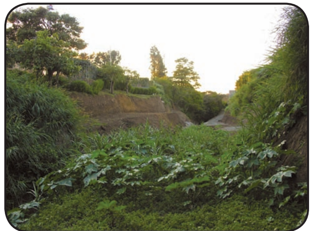
FIGURA 1. En los lotes baldíos de la Meseta Central ocurre un proceso de sucesión natural por el cual la vegetación retoma por sí misma una zona que había perdido su cubierta de plantas, como en esta carretera derrumbada en Santo Domingo de Heredia (2008-2010).