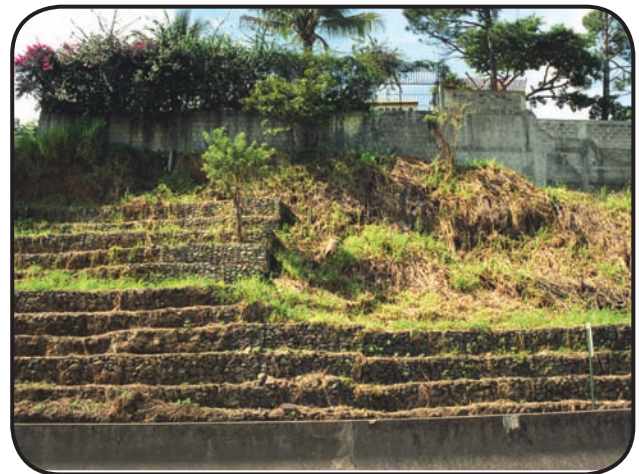
FIGURA 6. Las actividades de estabilización de terreno podrían convertirse en ejemplos de micro-restauración ecológica, pero actualmente solo se cubre el terreno con zacates. Sería mejor sembrar plantas adecuadas para obtener un microhábitat similar, en flora y fauna, al que existía originalmente allí.

La restauración ecológica es un proceso complejo que requiere de la participación de profesionales de distintas disciplinas. La inversión económica puede ser considerable, al igual que el grado de compromiso requerido. Los resultados de una correcta restauración ecológica solo pueden ser vistos a largo plazo. En las áreas urbanas de Costa Rica no existen proyectos serios de restauración, ya que la simple sustitución de especies introducidas por nativas, no garantiza la recuperación de la funcionalidad completa del ecosistema. En este campo, es prometedor el establecimiento en la UNED del Laboratorio de Ecología Urbana, segundo que se crea a nivel mundial y primero en los trópicos, cuyos estudios están estableciendo base científica para el desarrollo de proyectos de restauración ecológica en Costa Rica.