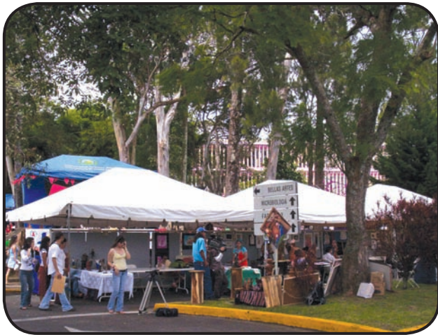
FIGURA 4. En el caso de zonas urbanas, el reestablecimiento de especies originales es difícil, por la lejanía de bosques grandes que sirvan de fuente y porque la extinción de fauna minimiza la dispersión de semillas, sin embargo, hay casos exitosos de recuperación. Por ejemplo, el campus de la Universidad de Costa Rica ha demostrado tener incluso especies nuevas para la ciencia.