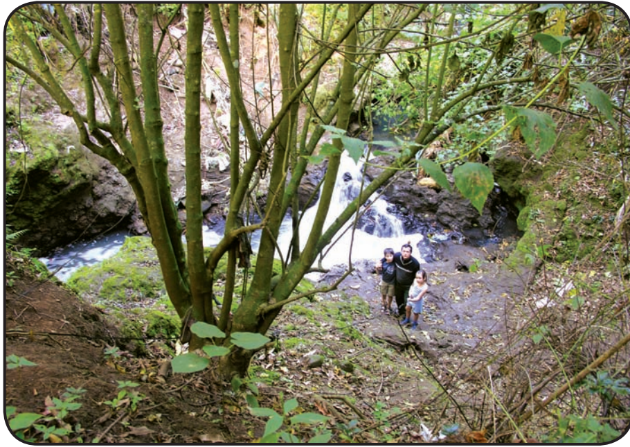
FIGURA 5. Las márgenes de los ríos urbanos no representan fielmente el bosque original de la Meseta Central, pero sí conservan muchas especies originales y con frecuencia son la única opción para proyectos baratos de restauración del ecosistema. Lamentablemente, el agua que fluye por ellos suele estar drásticamente contaminada, como en este riachuelo en el Parque Braulio Carrillo.