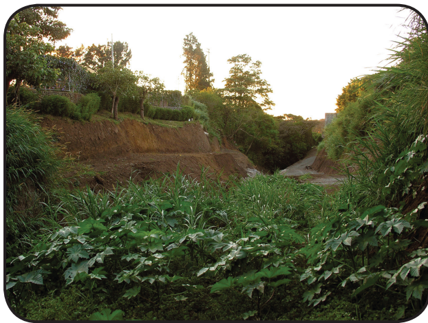
FIGURA 4. Evitemos el mal conservando árboles a cada lado de quebradas, riachuelos y otros cauces de agua; manteniendo más zona verde alrededor de las casas y dejando los parques y jardines con vegetación natural. Estas terrazas alrededor de un pequeño riachuelo fueron construidas con el fin de evitar la erosión, pero también se convirtieron en hábitat para muchas plantas y animales.

El tener presentes los principios de la Bioética evitaría el mal en la biodiversidad urbana por medio de actuaciones que impidan su disminución, por ejemplo, el empleo de más espacios de zona verde alrededor de las casas (Figura 4). Como se mencionó, la salud mental del ser humano mejora cuando hay más vegetación a la vista, por ello las municipalidades deberían cambiar sus códigos de construcción para lograr incrementar las zonas verdes y asegurarse que estén interconectadas, lo que las convierte en corredores y refugio de la fauna y la flora. También es importante propiciar que se siembren plantas nativas en vez de las especies introducidas que abundan en los viveros.