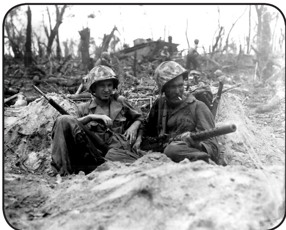
FIGURA 2. En el siglo XX, el gobierno nazi hizo un enorme daño a los ecosistemas de Europa, Asia y Norte de África, debido al desarrollo industrial y a la Segunda Guerra Mundial.

Se señalan los anteriores casos extremos, en los que inesperadamente la biodiversidad sufre por una parte y gana por otra, con el propósito de introducir el concepto de bioética. La Bioética por su parte es una rama de la filosofía que estudia los conceptos del bien y el mal en relación con los fenómenos biológicos. La rama de la bioética que más se ha trabajado es la que se relaciona con las personas, en la cual el ser humano tiene la máxima jerarquía (Serrano Ruíz-Calderón, 2003). No obstante, las