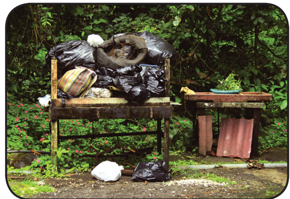
FIGURA 3. El reciclaje es solamente una de varias estrategias que tenemos para atender debidamente nuestros deberes ambientales. Aquí, la basura de una estación de guardaparques espera para ser reciclada en el Parque Nacional Braulio Carrillo.

Como la mayoría de la población humana pasa su vida en el ecosistema urbano, es de suma importancia que todos los pobladores, no solo los empresarios, desarrollen la conciencia y la responsabilidad ambiental a la que se ha hecho referencia en párrafos anteriores. Es deber de las universidades generar el conocimiento y transmitirlo a los futuros profesionales del país, de modo que puedan contribuir al cambio con conocimientos técnicos de avanzada