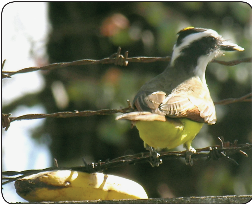
FIGURA 5. Hagamos el bien facilitando espacios para anidación; alimento para aves y otros organismos y dejando piedras, hojarasca, troncos y ramas en todas las áreas urbanas que resulte posible.